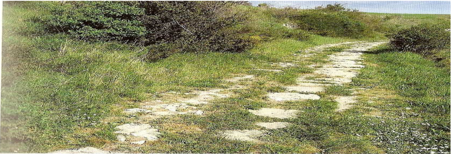
Antigua calzada romana entre el puente del Aire y Puente Arenas

zigzagüeante, iniciando una subida al portillo de la Labrada (625 m), tallado en la roca a lo largo del monte de la Labrada.